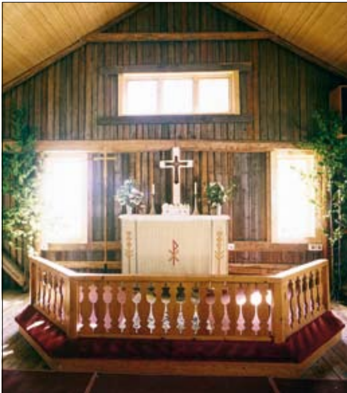
Koret i logkyrkan en solig sommardag.

Gården är en omtyckt plats för dop och vigslar och erbjuder möjligheter att ta emot för såväl dop- som vigselkaffe.