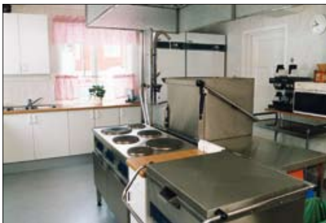
Köket i huvudbyggnaden.