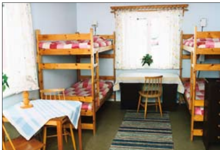
Interiörer från Hus 1.