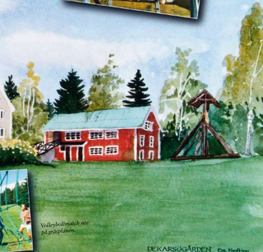
Volleybollmatch ute på gräsplanen.