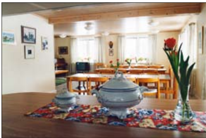
Utsikt över matsalen från köket.

Gården kan hyras med hel-, halvpension eller självhushåll. Gården kan även tillhandahålla mat för självhushåll efter överenskommelse.